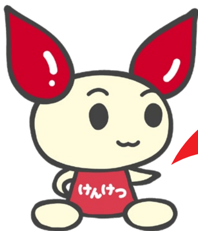
献血キャラクター けんけつちゃん

新型コロナウイルス 感染の拡大下でも、 毎日約3,000人の 患者さんが輸血を 必要としています。