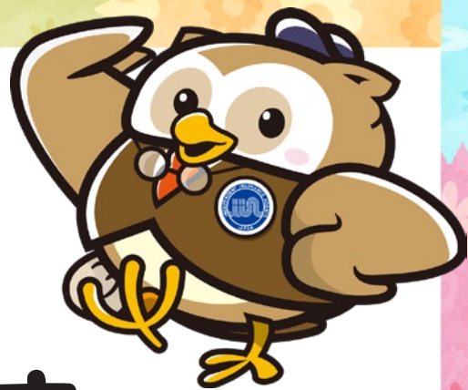
代協キャラクター 森の賢者“ふうた”