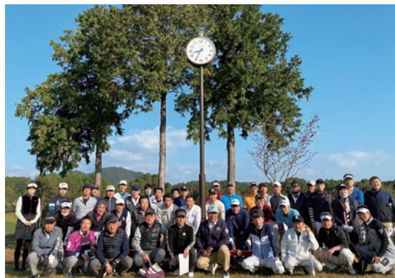
SUNGOLF&RESORTワカミヤ・コース (旧若宮ゴルフクラブ)