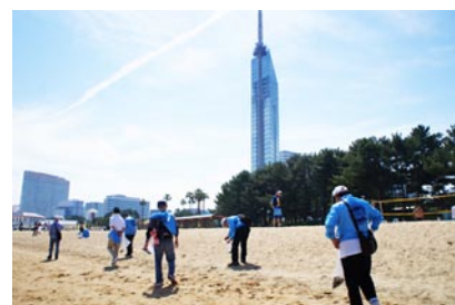
(2018年のラブアース:百道浜会場)

※新型コロナウイルスの状況により、全市一斉清掃の延期や中止など開催内容が変更となる可能性があります。ご了承ください。